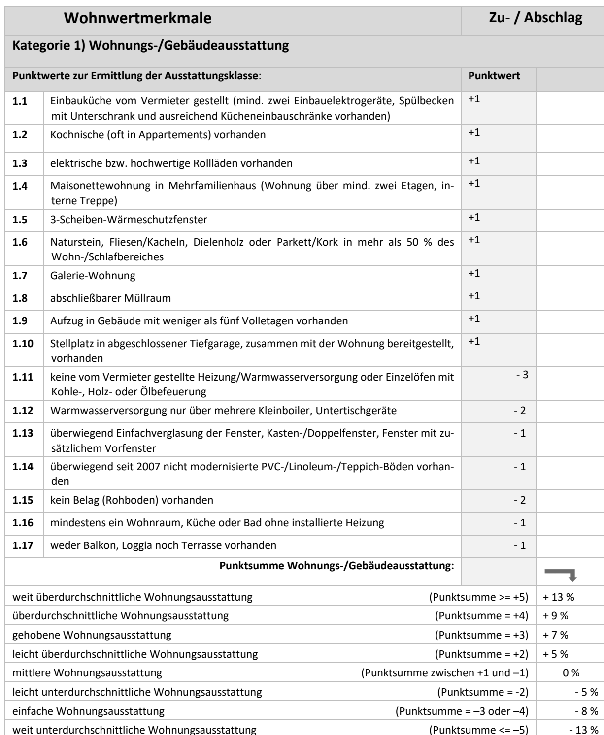
Tabelle 2: Weitere Wohnwertmerkmale, die den Mietpreis signifikant beeinflussen